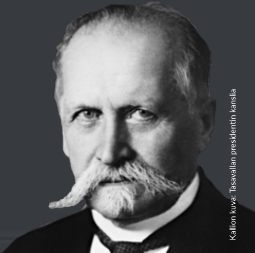
Kallion kuva: Tasavallan presidentin kanslia