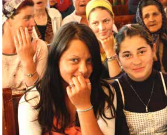
Romaanilaisia romaaneja kokouksessa